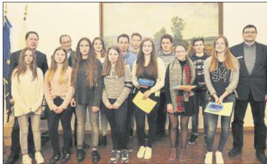
Besonderes Engagement bewiesen die 15 Jugendlichen, die erstmals auch bei den Gedenkfeiern im November gesammelt haben.