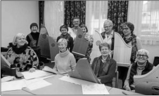
Das Veeh-Harfen-Ensemble bietet „Musik und Lyrik in Kombination“ und musizierte schon bei zahlreichen Anlässen.