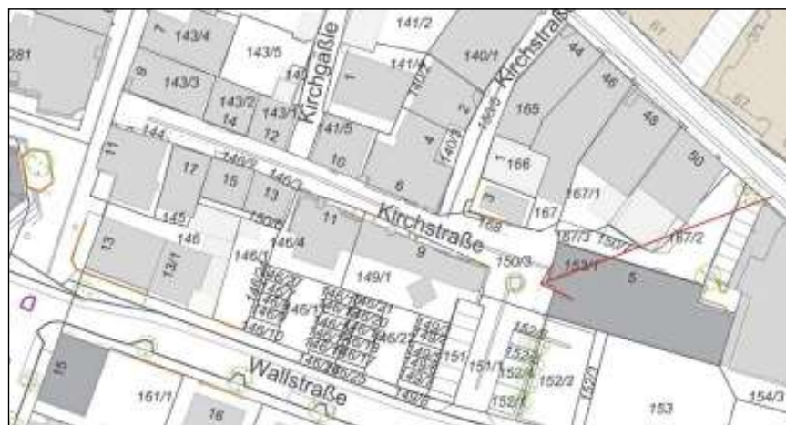
Der rote Pfeil verdeutlicht, wo die Baumpflanzung stattfinden wird.

Die Bevölkerung ist herzlich zu diesen Veranstaltungen eingeladen.