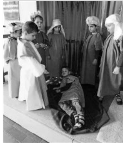
Die Kinder des Paul-Schneider-Kinderhauses bei einer Probe für den Familiengottesdienst.

„Jesus ist da, er ist heute in Kapernaum. Du musst unbedingt mitkommen“, rufen sie, sie singen und haben rote Bäckchen vor Aufregung.