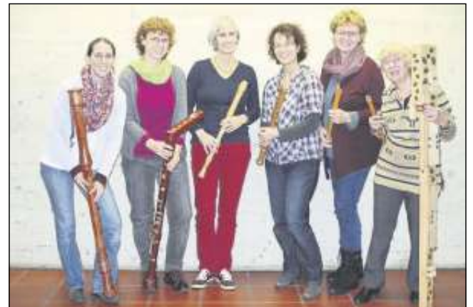
Am 5. März ist das Ensemble „Noble noyse“ in der Schlosskirche zu hören.