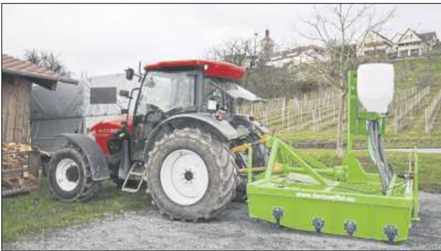
Der grüne Wiesenbüffel steht in Winnenden-Bürg und kann bei Bernd Bauer ausgeliehen werden.

In den vergangenen Jahren ist die Wildschweinpopulation in ganz Baden-Württemberg massiv gewachsen und damit das Ausmaß an Schäden, welches die Schwarzkittel auf Wiesen und Äckern verursachen. Auch um Winnenden und die Umgebung machen die Wildsäue keinen Bogen. Für die betroffenen Landwirte bedeutet das oft enorme Schäden. Die Wildschweine wühlen in einer Nacht ganze Wiesen um. Futtererträge, auf die die Landwirte eigentlich angewiesen wären, können nicht erzielt werden. Aus diesem Grund hat die Jagdgenossenschaft Winnenden im November 2015 einen „Wiesenbüffel“ im Wert von gut 16.900 Euro beschafft, der die Schäden wieder einenet.