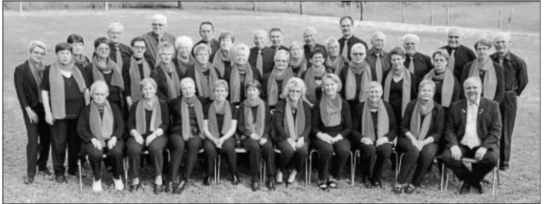
Der Gesangsverein „Frohsinn“ Birkmannsweiler wird mit seinem „Gemischten Chor“ erfrischenden Gesang bieten.

Heute in 16 Tagen ist die Hermann-Schwab-Halle wieder Schauplatz des traditionellen Seniorenachmittags der Stadt Winnenden. Alle älteren Mitbürgerinnen und Mitbürger aus der Großen Kreisstadt sind dazu aufs Herzlichste eingeladen.