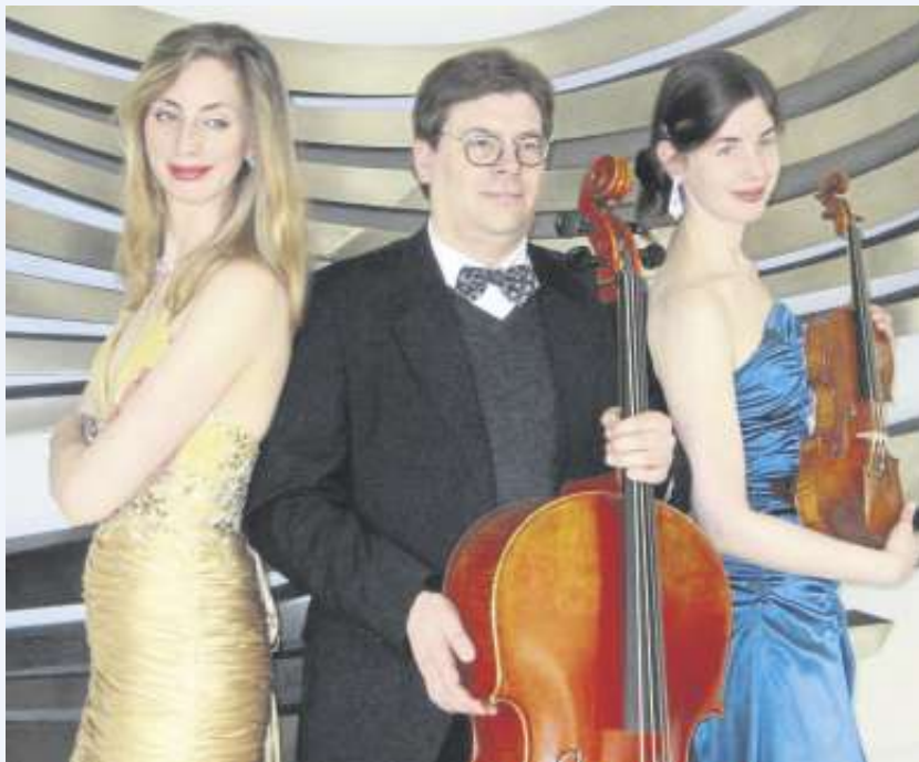
Das „Klaviertrio Würzburg“ kommt nach Winnenden.

Zu der Matinee am Sonntag, 6. März, gastiert im Andachtsaal des Klinikums Schloss Winnenden das arrivierte und viel beschäftigte Klaviertrio Würzburg. Mit seinem Namen zollt es jenem Ort Referenz, wo es seine ersten Meriten erworben hat - Würzburg. Musiker und Rezensenten bescheinigen dem Ensemble „herausragende Kompetenz“ und „mitreißendem Schwung“. Die Mitglieder des Trios verfolgen eine rege Lehrtätigkeit im Bereich der Solo-/Instrumental- bzw. Kammermusik.